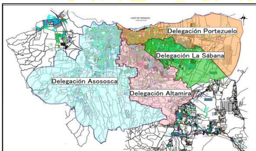
Figura N°01. Macro localización de la Delegación Altamira

Los servicios objetos de esta consultoría se efectuarán en el sector de Altamira. El área de intervención es denominada Delegación Altamira y corresponde a una de las cuatro delegaciones en las que se divide la administración técnica y comercial de los sistemas de agua y saneamiento de ENACAL en Managua. A nivel administrativo el sector de Altamira cubre 186 barrios de la ciudad con 43,224 usuarios (conexiones), sobre un total de 224,666 usuarios en Managua. A nivel geográfico representa el 15% de la extensión de toda la ciudad de Managua con 79 kilómetros cuadrados. Se encuentra ubicada en la zona central de la Ciudad de Managua. (Ver Figura N°01).