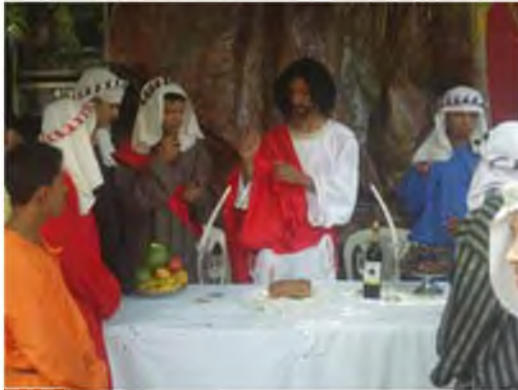
La Santa Cena.