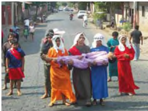
Juan el Bautista.