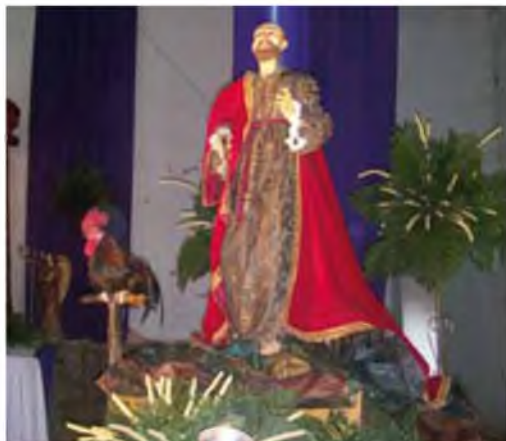
Misa en honor a San Pedro.