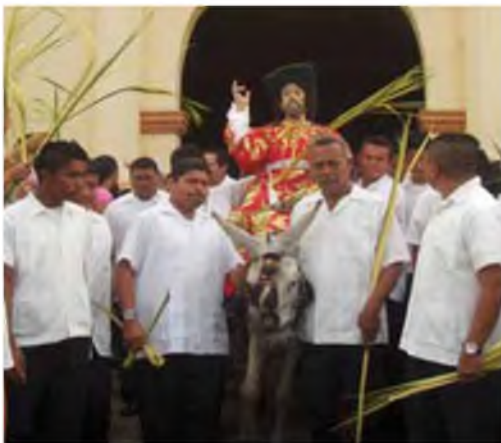
Procesión de la Burriquita.

Bendición de Palmas, procesión de las palmas hacia el templo. Solemne procesión de la burriquita hacia la Catedral.