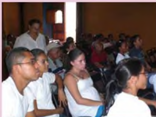
Presentación de los Resultados del primer muestreo del sector gastronómico de Sutiaba.

Los resultados plasmados en el cuarta edición boletín informativo, es un primer muestreo que se realizó con las mujeres emprendedoras del sector gastronómico de Sutiaba, producto del enlace entre la Universidad Nacional Autónoma de León y el programa de las Naciones Unidas, MyDEL (Mujeres y Desarrollo Local), con el objetivo de visualizar y aprovechar el trabajo de las mujeres emprendedoras de Sutiaba para fines turístico, cuyos resultados se implementarán en acciones encaminadas al desarrollo económico local del pueblo indígena de Sutiaba, que se impulsan dentro del Proyecto de Patrimonio para la revitalización del pueblo indígena de Sutiaba.