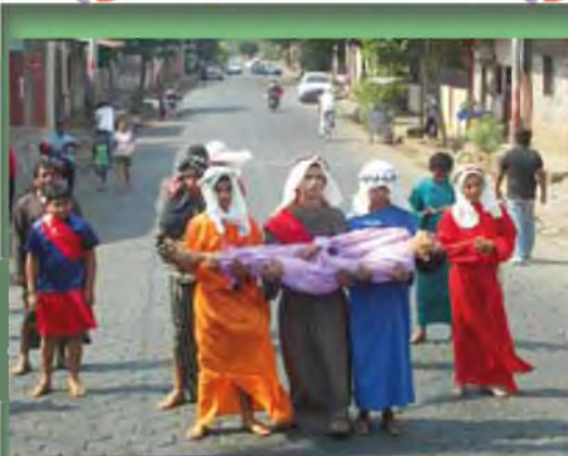
Juan el Bautista.