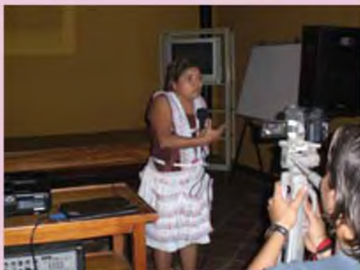
Participación de mujeres emprendedoras del sector gastronómico de Sutiaba.