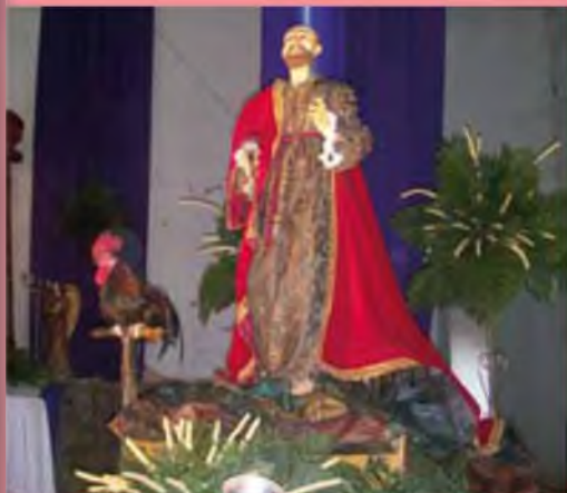
Misa en honor a San Pedro.

Procesión de Jesús Resucitado y la Santísima Virgen María.