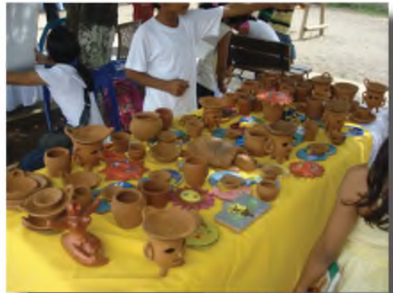
Taller de Alfarería.

El domingo 22 de Agosto del presente año se realizó la II FERIA ARTISTICA CULTURAL DE SUTIABA, evento donde se demostró los avances, logros, resultado e interpretaciones de cada una de las expresiones culturales que se impartieron durante el segundo semestre en los Talleres Didácticos Culturales.