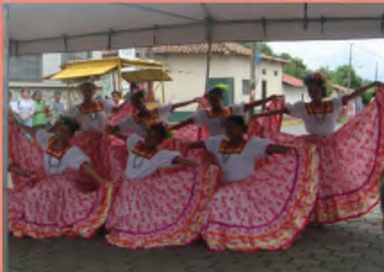
Taller de Danza.