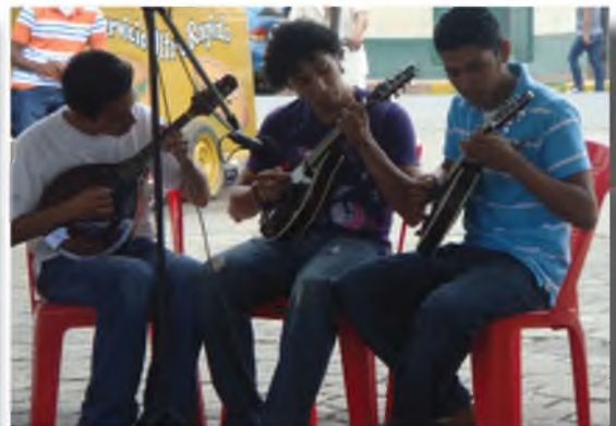
Taller de Música, Mandolina