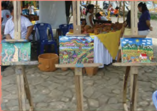
Taller de Pintura Primitivista.