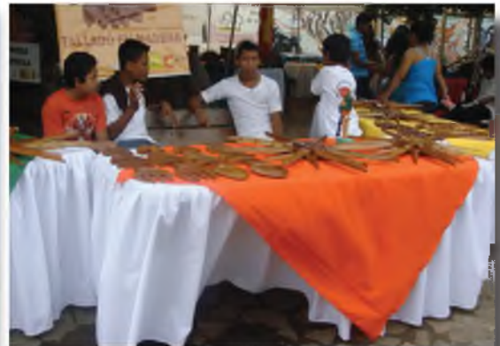
Taller de Tallado en Madera.